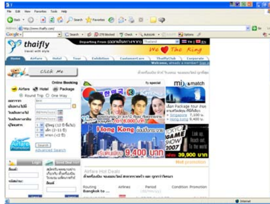
รูปที่ 7.7 เว็บไซต์ไทยฟลายดอตคอม (www.ThaiFly.com)

ในส่วนของการจองตั๋วเครื่องบินนั้น ผู้ที่ต้องการจะสั่งจองตั๋วเครื่องบินผ่านทางเว็บนี้จะเริ่มต้นด้วยการค้นหาสายการบินที่ต้องการจะเดินทางโดยกำหนดเงื่อนไขว่าจะเป็นการจองตั๋วเครื่องบินแบบไป-กลับหรือเที่ยวเดียว จะเดินทางไปประเทศใด จังหวัดหรือเมืองใด เดินทางออกจากประเทศใด จังหวัดหรือเมืองใด จะเดินทางไปเมื่อใด จะเดินทางกลับเมื่อใด และจำนวนผู้ที่จะเดินทางกี่คน แล้วคลิกตรงคำว่า “ค้นหาสายการบิน” ทางเว็บจะคัดเลือกสายการบินตามเงื่อนไขที่กำหนดไว้ เมื่อได้รายละเอียดสายการบินตามที่ต้องการก็สามารถสั่งจองตั๋วเครื่องบินผ่านเว็บได้เลย ทางเว็บจะให้รหัสผ่านที่ต้องแจ้งแก่พนักงานหรือเจ้าหน้าที่ของทางโรงแรมเพื่อเป็นการยืนยันตัวผู้ใช้บริการ ซึ่งผู้ใช้บริการจะต้องจดจำรหัสผ่านนี้ให้แม่นยำเพื่อป้องกันการผิดพลาด เช่นเดียวกับการสั่งจองโรงแรมหรือที่พักผ่านเว็บอื่น ๆ [76]