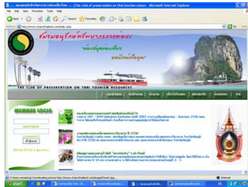
รูปที่ 7.2 เว็บไซต์ไทยแลนด์ดอตคอม (www.ChaiyoThailand.com)

ภายในเว็บไซต์ไทยแลนด์ดอตคอม จะประกอบไปด้วยข้อมูลที่เกี่ยวข้องกับการท่องเที่ยวมากมาย อาทิ