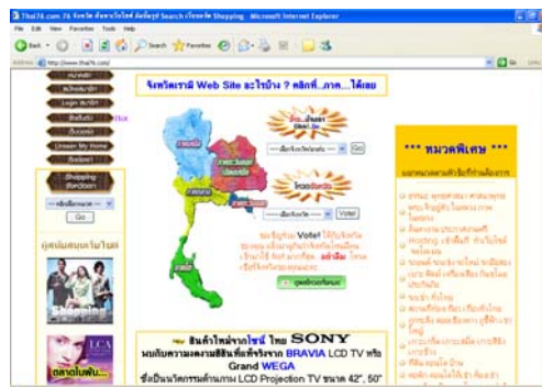
รูปที่ 7.4 เว็บไซต์ไทย 76 ดอตคอม (www.Thai76.com)

เว็บไทย 76 ดอตคอม (www.Thai76.com) ดังแสดงในรูปที่ 7.4 เป็นเว็บที่เป็นศูนย์รวมของเว็บทั้ง 76 จังหวัดทั่วประเทศไทย [74]