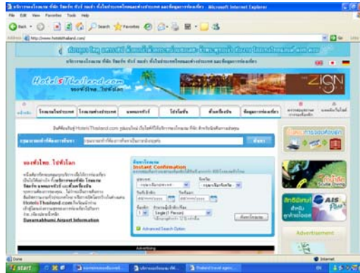
รูปที่ 7.6 เว็บไซต์ไทยแลนด์ดอตคอม (www.HotelsThailand.com)

การท่องเที่ยว ภายในเว็บจะแบ่งการค้นหาออกเป็น โรงแรมในประเทศ โรงแรมต่างประเทศ วัตถุประสงค์โรงแรม และบริการการท่องเที่ยวอื่น ๆ อาทิ บริการรถรับ-ส่ง บริการรถเช่า แพคเกจทัวร์ และบริการสอนหลักสูตรดำน้ำลึก เป็นต้น