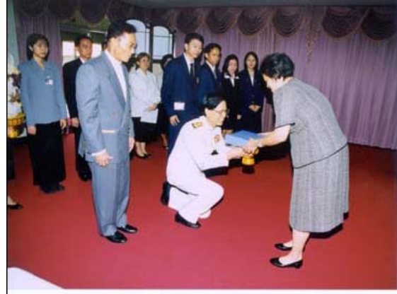
รูปที่ 3.4 สมเด็จพระเทพรัตนราชสุดาฯ สยามบรมราชกุมารี พระราชทานพระราชานุญาตให้เข้าเฝ้าถวายห้องสมุดดิจิทัล