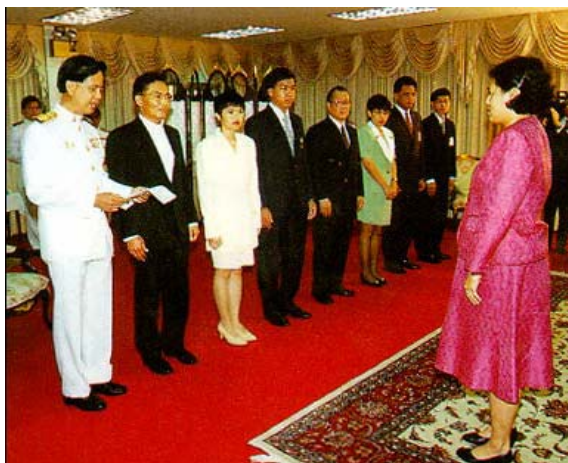
รูปที่ 3.2 สมเด็จพระเทพรัตนราชสุดาฯ สยามบรมราชกุมารี ทรงพระกรุณาโปรดเกล้าฯ พระราชทานพระราชนุญาตให้บริษัทเคเอสซีและมหาวิทยาลัยอัสสัมชัญเช่าฝ้าทูลเกล้าฯ ถวายเครื่องคอมพิวเตอร์และอุปกรณ์เชื่อมโยง Node ความเร็ว 2 Mbps