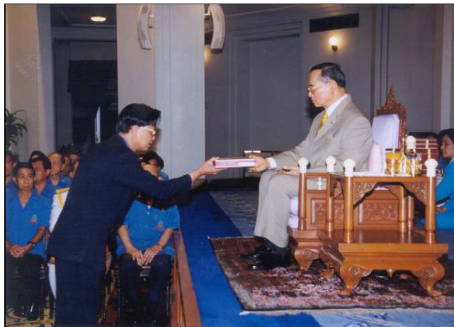
รูปที่ 3.1 พระบาทสมเด็จพระเจ้าอยู่หัวทรงพระกรุณาโปรดเกล้าฯ พระราชทานโล่

ก่อนเสด็จแปรพระราชฐานไปวังไกลกังวล ทางในวังก็จะโทรศัพท์มาแจ้ง ผู้บรรยาย ก็จะขอให้ห้องเคเบิลโทรศัพท์ที่จัดสายโทรศัพท์แบบพิเศษ (Leased Line) เชื่อมต่อจากอัสสัมชัญหรือเคเอสซี ไปยังวังไกลกังวล บางครั้งก็นำเครื่องคอมพิวเตอร์ไปตั้งในห้องทรงงาน จัดการทดลองว่าใช้ได้ดี ให้พร้อมที่จะทรงใช้ได้ เมื่อเสด็จกลับกรุงเทพ ทางในวังก็จะแจ้งให้ผู้บรรยายไปนำเครื่องคอมพิวเตอร์กลับได้ โครงการดีแอลเอฟผู้บรรยายก็ได้จัดให้เจ้าหน้าที่ช่วยทำเว็บให้ด้วย ดังแสดงในรูปที่ 3.1