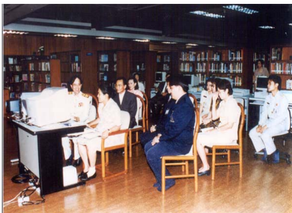
รูปที่ 3.3 สมเด็จพระเทพรัตนราชสุดาฯ สยามบรมราชกุมารี ทรงพระกรุณาโปรดเกล้าฯ ให้เข้าฝ้าถวายการบรรยายหลักสูตรอินเทอร์เน็ตระยะสั้น

สมเด็จพระเทพรัตนราชสุดาฯ สยามบรมราชกุมารี ทรงพระกรุณาโปรดเกล้าฯ ให้เข้าฝ้าถวายคำบรรยายหลักสูตรอินเทอร์เน็ตระยะสั้น ดังแสดงในรูปที่ 3.3